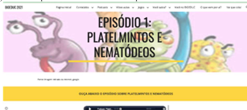
Figura 1. Foto da página do site para acesso ao Podcast - Episódio 1.