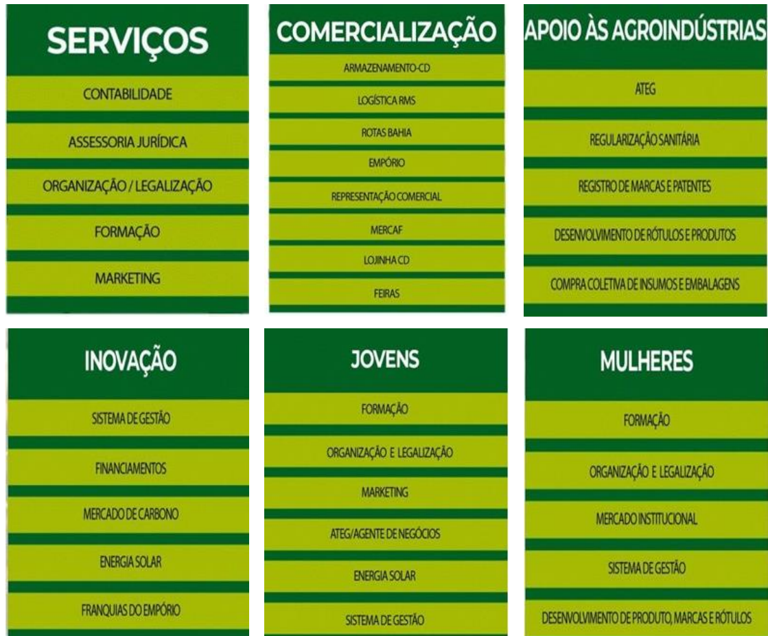
Figura 03. Composição do Planejamento Estratégico da Unicafes Bahia.

De acordo com Gonçalves et al. (2018), é importante a obtenção da participação dos cooperados para os desafios na implantação de uma proposta de gestão eficiente, moderna, além de uma atitude estratégica direcionada ao processo de comercialização.