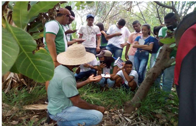
Reserva legal e o microclima