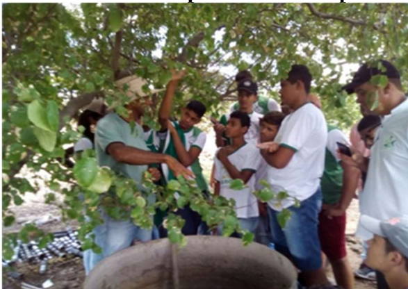
Explicação sobre Biofertilizante